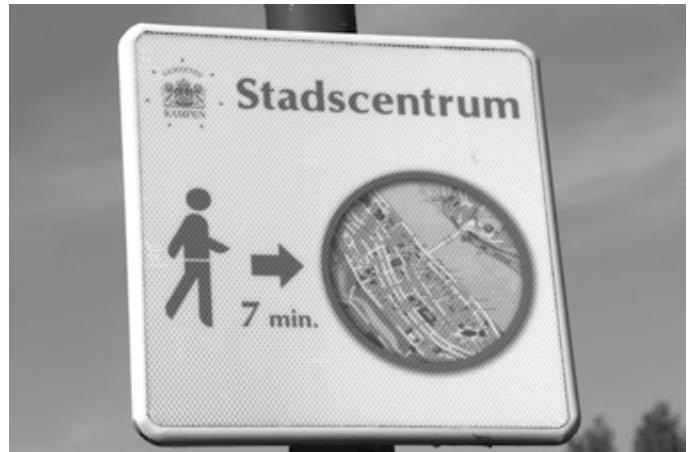
Dit bord staat bij de Turnhal, op 300 meter van de winkels in de Geerstraat. Een winkelstraat die wandelend in 4 minuten te bereiken is

Wat heet! Versterking van leefbaarheid, die zichtbaar is in verfraaiing van de openbare ruimte en vergroening genereert een proces dat ten goede komt aan alle betrokkenen. Zo'n binnenstad wil je toch gastvrij delen met anderen? Het willen uitstralen van