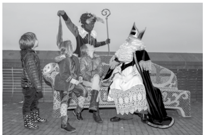
Sinterklaas had de eer om de aftrap te verzorgen voor de sofaserie in Kampen.nl. De foto's werden gemaakt door Frits Felix. Hij is een bevlogen natuurfotograaf. Zie: www.felixfoto.nl .

Met het nieuwe sofaproject willen de Stadskazerne en de Wijkver-